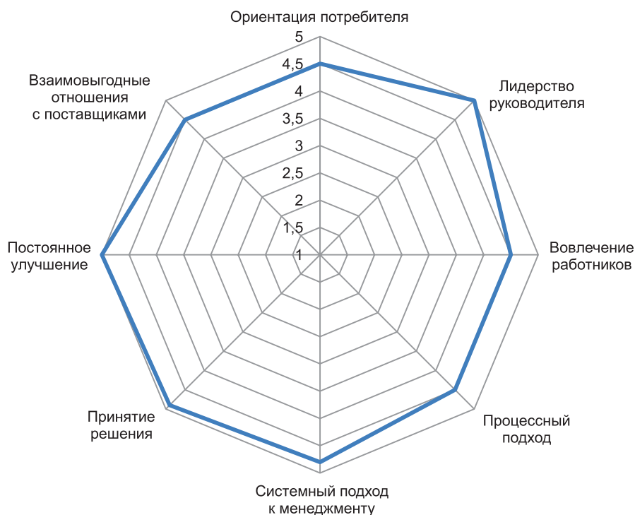
Рис. 2. Результаты проведенной самооценки СМК клинического госпиталя