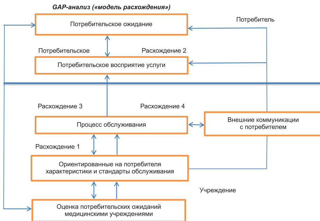
Рис. 3. Самооценка СМК клинического госпиталя показала высокий уровень зрелости

нения в макро- и микросреде, оценивать эффективность решений в области управления качеством.