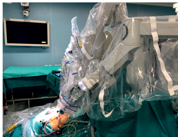
Рис. 1. Отключенный порт камеры роботической системы для извлечения препарата с целью выполнения срочного гистологического исследования

Техника интраоперационного гистологического исследования замороженных срезов участков предстательной железы, прилегающих к сосудисто-нервному пучку. При разработке собственной методики за основу взято исследование Т. Schlomm et al. [7] и последующая адаптация для робот-ассистированной хирургии этой же группой авторов [8]. После удаления предстательная железа с семенными пузырьками помещается в заранее введенный в брюшную полость эндоскопический мешок. Извлечение препарата не требует полного отключения роботической системы: выполняется отключение камеры (рис. 1), после чего камера вводится в латеральный ассистентский порт и препарат под контролем зрения извлекается через супраумбиликальный разрез для порта камеры.